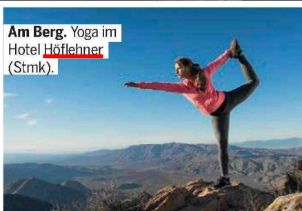
Am Berg. Yoga im Hotel Höflehner (Strmk).