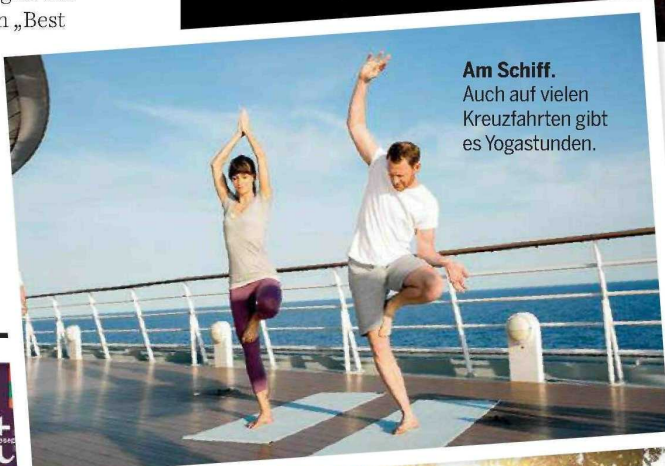
Am Schiff. Auch auf vielen Kreuzfahrten gibt es Yogastunden.