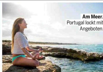
Am Meer. Portugal lockt mit Angeboten.