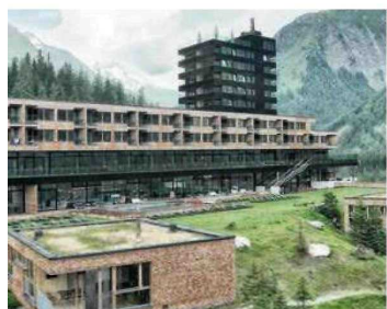
Ökologisch. Das Gradonna****s Mountain Resort Châlets & Hotel.

Top-Hotel wird heuer zum zweiten Mal in Folge „Europe’s Leading Green Resort“.